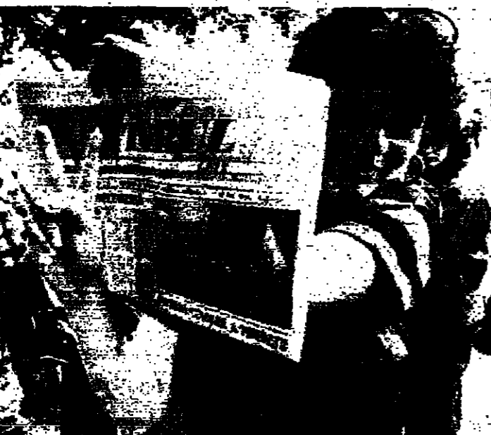
مجلس جبهة الانتقاذ... وشارة النصر... عليه الانتخابات (رويترز)